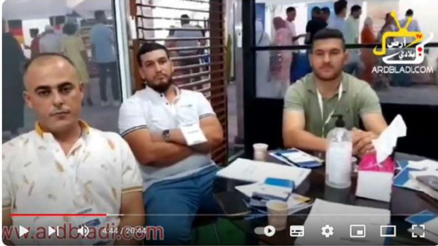
افتتاح معرض بالناظور....منتجات حديثة من داخل و خارج الوطن دخلوا تكتشفوا اخر ما كاين